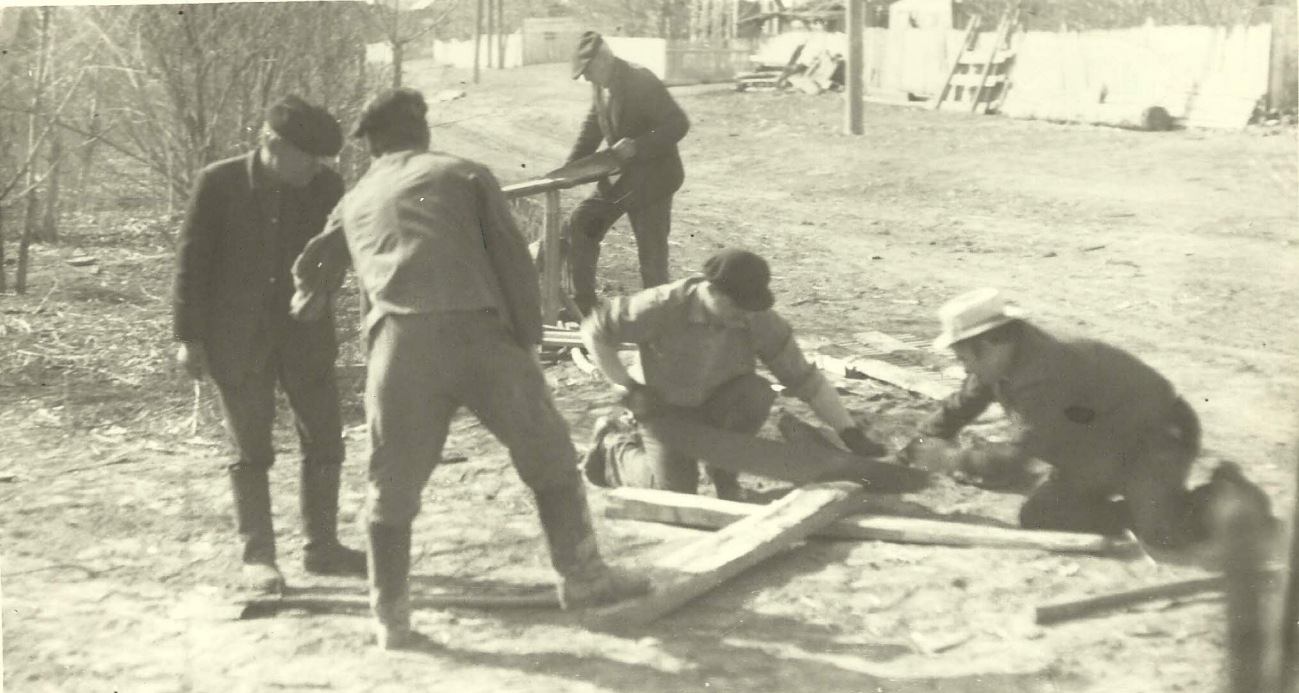
Субботник на строительстве школы 60-е годы